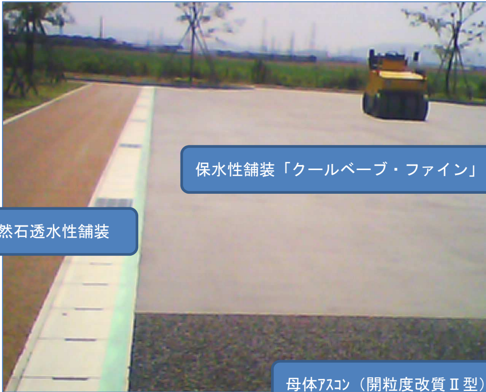
自然石透水性舗装